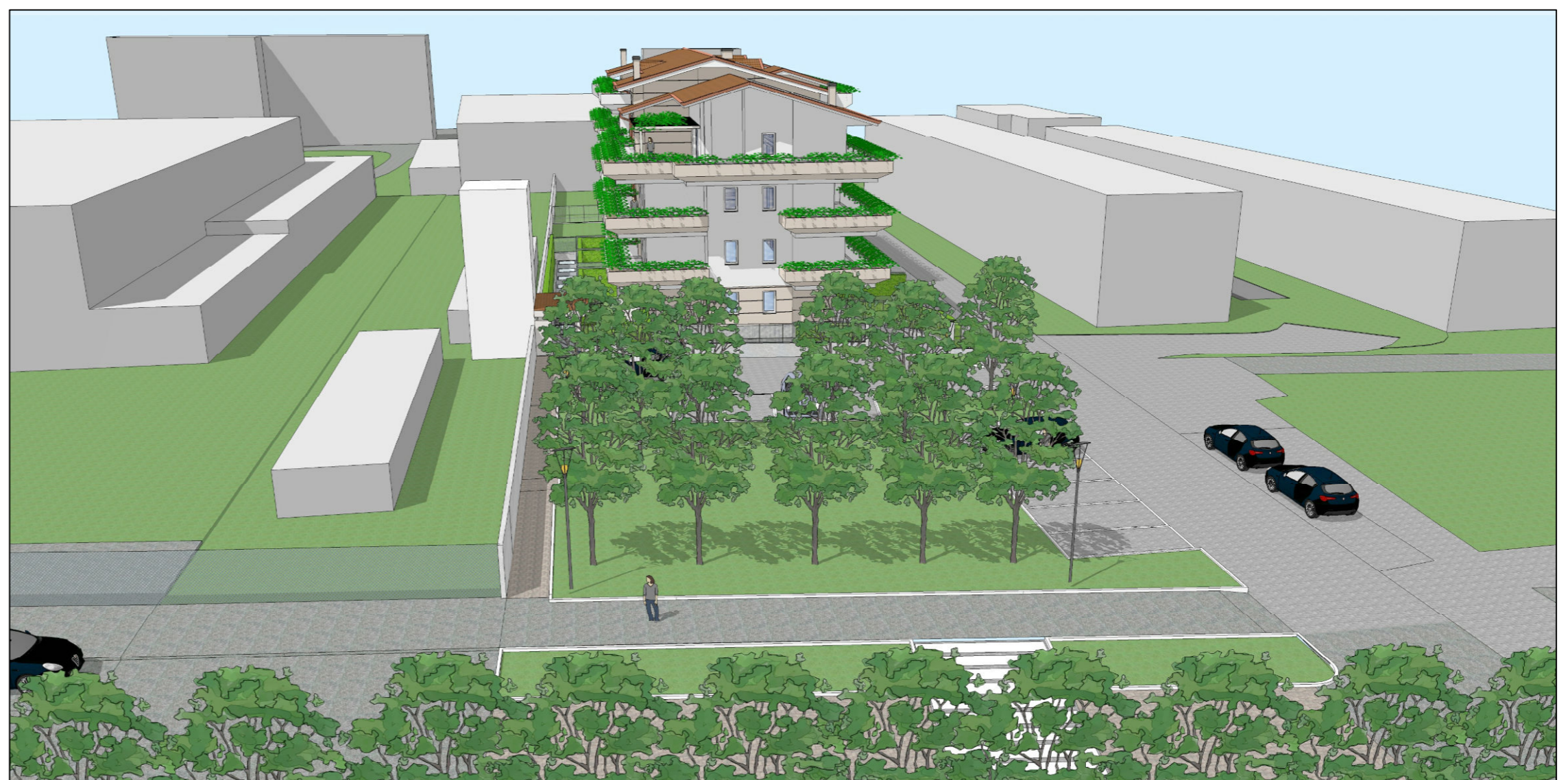
PROSPETTO NORD vista da Via Senato